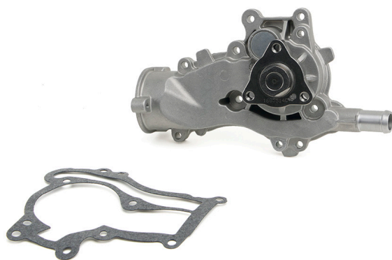
Figura 1: 538 0314 10 - Pompă de răcire cu garnitura aferentă

Pompa de răcire 538 0314 10 este etanșată cu o garnitură. NU utilizați etanșări suplimentare.