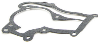
Зображення 1: 538 0314 10 - Насос охолоджувальної рідини з плоским ущільненням, що входить у комплект постачання

Насос охолоджувальної рідини ущільнюється тільки плоским ущільненням, тому під час монтажу ЗАБОРОНЯЄТЬСЯ наносити додатковий шар герметика.