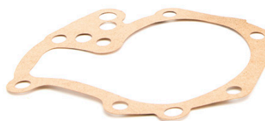
Slika 2: Nova izvedba

Vodne pumpe kataloškog broja 538 0021 10 odsad se isporučuju sa modificiranim kućištem. Kod nove je izvedbe kućišta, na mjestu označenom strelicom na gornjoj slici, eliminiran jedan od provrta (slika 2).