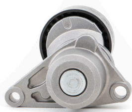
תמונה 1: עיצוב קודם