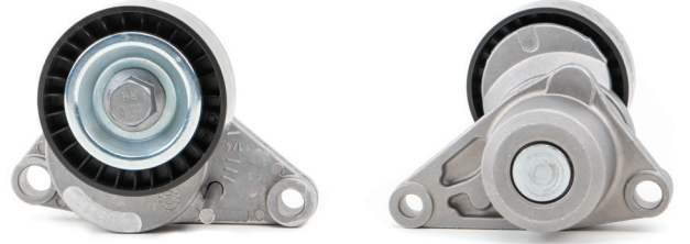
Resim 1: Eski tasarım

Güncel liste için medya kataloğuna bakın