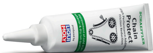
Снимка 1: Schaeffler Chain Protect е разработен специално за използване при монтаж на нови ангренажни вериги. Добавката е налична само в INA Timing Chain KIT.

По време на ремонта трябва да се използва цялото съдържание на тубичката. Добавката трябва да се прилага към всички компоненти - тоест ангренажната верига и всички зъбни колела, както и водачите. Тя се смесва с двигателното масло и остава в двигателя до следващата смяна на маслото.