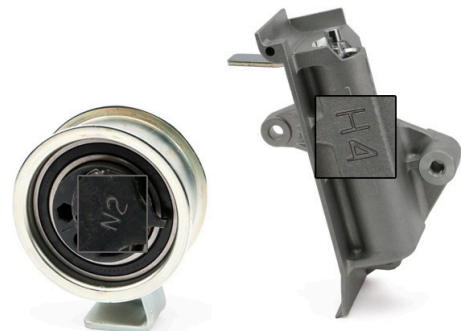
Εικόνα 2: Τεντωτήρας 531 0436 20 με τον αποσβεστήρα 533 0035 10