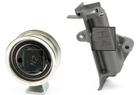
Kuva 2: Kiristinpyörä 531 0436 20 ja värinänvaimennin 533 0035 10