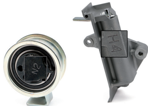
Afbeelding 2: Spanrol 531 0436 20 met trillingsdemper 533 0035 10