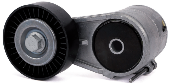
Fig. 1: Ejemplo de un modelo anterior con patilla de montaje

Ambos modelos cumplen con las especificaciones técnicas y pueden utilizarse sin limitaciones. Es posible que se mezclen ambos modelos durante la fase de transición.