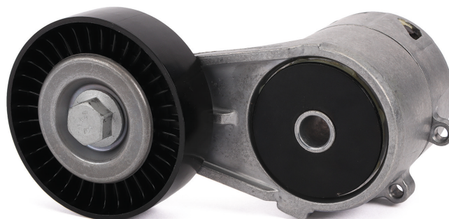
Fig. 2: Exemplo de um modelo novo sem pino de montagem

Observar as indicações do fabricante do veículo.