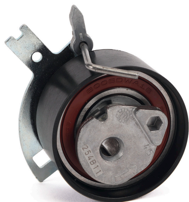
Снимка 1: Обтяжна ролка 531 0810 10

Съблюдавайте спецификациите на производителя на автомобила!