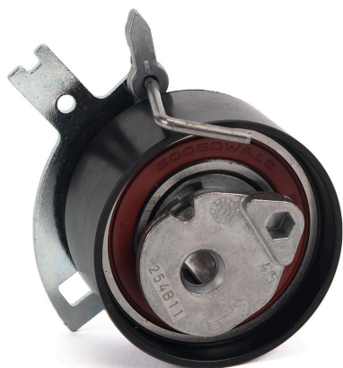
Obrázek 1: Napínací kladka 531 0810 10

Obě provedení splňují technické specifikace a lze je tedy používat bez omezení. V přechodové fázi mohou být k dispozici smíšené zásoby obou provedení.