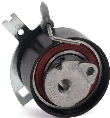
Kuva 1: Kiristinpyörä 531 0810 10

Molemmat mallit täyttävät tekniset vaatimukset ja niitä voidaan käyttää rajoituksetta. Siirtymävaiheessa voi varastossa olla molempia malleja.