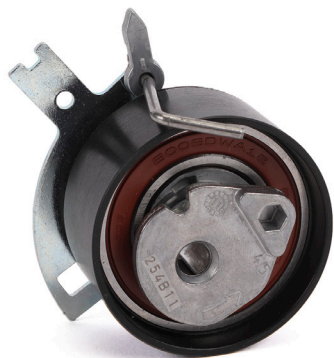
Slika 1: Remenica zatezača 531 0810 10

Aktualni pregled primjene dijela potražite u katalogu.