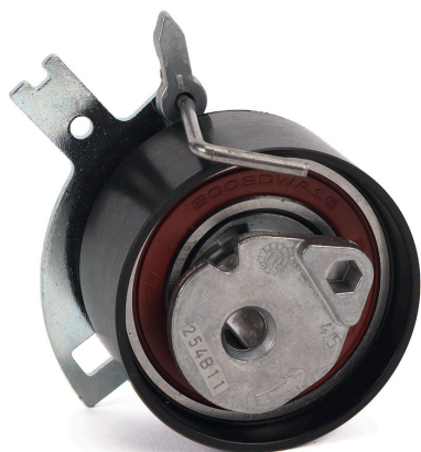
1. ábra: Feszítőgörgő 531 0810 10

Mindkét típus teljesíti a műszaki specifikációkat és azokat korlátlanul fel lehet használni. Az átmeneti időszakában vegyes készletek fordulhatnak elő.