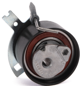
Fig. 1: Polia tensora 531 0810 10

Observar as indicações do fabricante do veículo.