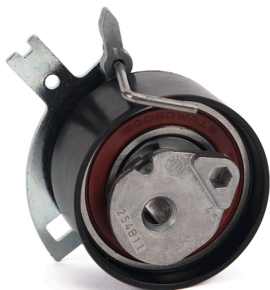
Figura 1: Rola de tensionare 531 0810 10

Ambele versiuni îndeplinesc specificațiile tehnice și pot fi utilizate fără restricții. În perioada de tranziție stocurile de produse pot să conțină ambele variante.