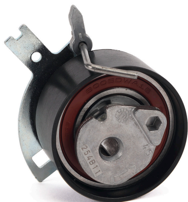
Зображення 1: Натяжний ролик 531 0810 10

Дотримуйтеся рекомендацій виробника транспортного засобу!