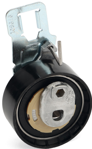
Kuva 1: Vanha malli muovisella juoksupinnalla

Schaeffler Automotive Aftermarket c/o Schaeffler Finland Oy info.fi@schaeffler.com www.schaeffler.fi/aftermarket