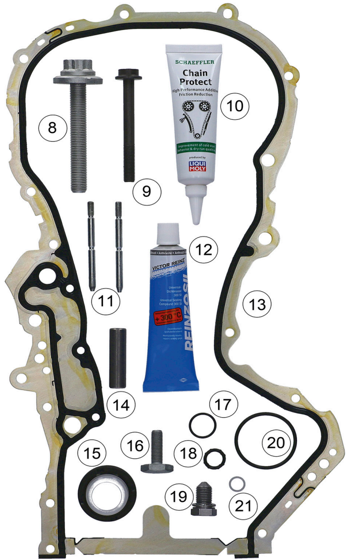
Kuva 2: 559 0154 30/559 0154 31 - jakoketjuserjan asennusosat

Tämän lisäksi ei joissakin moottorikoodin CAXA omaavissa moottoreissa käytetä öljypumpun käyttöön hammas-, vaan rullaketjua. Tässä tapauksessa on vaihdettava myös käyttöketju (OE-numero 03C 115 225 A), ketjun kiristin (OE-numero 03C 109 507 AD) ja öljypumpun ketjupyörä (OE-numero 03C 115 121 J).