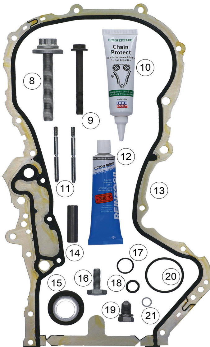
Figura 2: 559 0154 30/559 0154 31 - Allegati KIT catena di distribuzione

Come ausilio di montaggio sono inclusi i due perni di guida del KIT catena di distribuzione per il montaggio dell'alloggiamento di controllo e della coppa dell'olio. Essi vengono avvitati nella testata o nel blocco cilindri.