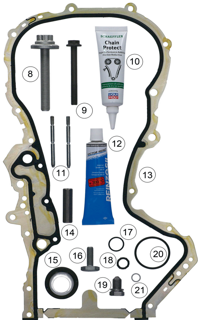
Зображення 2: 559 0154 30/559 0154 31 - Вміст комплексу ланцюгового привода ГРМ

Обидва комплекти ланцюгового привода ГРМ містять напрямні штифти для монтажу кришки привода розподільчого механізму та піддона картера в якості допоміжного монтажного інструмента. Їх необхідно закрутити в головку блока циліндрів і в блок циліндрів.