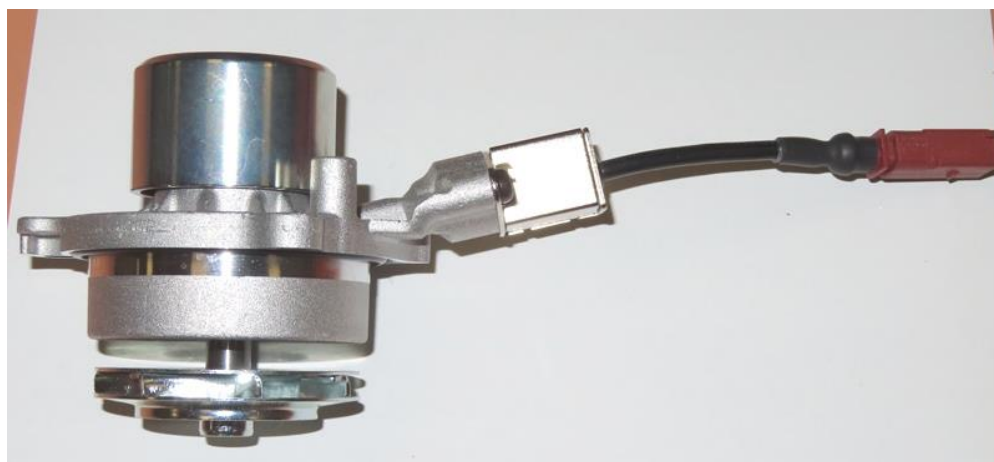
Foto 4 – picture 4: pompa acqua 24-1360A-8 / PA1360A-8 / 101360A-8 con cavetto water pump 24-1360A-8 / PA1360A-8 / 101360A-8 with cable

ATTENTION: The water pump 24-1360A-8 / PA1360A-8 / 101360A-8 with cable (Picture 4) is a single spare part, absolutely do not disassemble the cable supplied with Metelli-Graf-KWP pumps to use it on OE pumps or pumps of other manufacturers, since it is not suitable for switchable water pumps. Metelli spa declines all responsibility for improper use of the cable