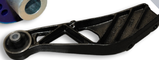
Support de montage complet - ADT38056C