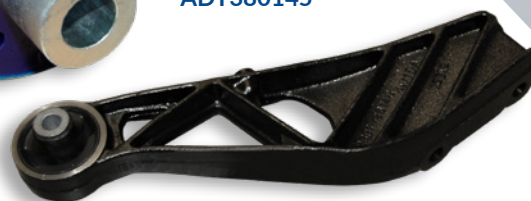
Suportul complet - ADT38056C