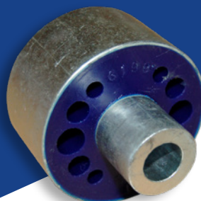
Bucsa din poliuretan - ADT380145

Toyota Hiace, Granvia, Grand Hiace (Grey Import) toate modelele 1995>