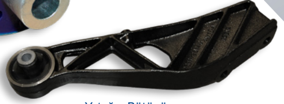
Yatağın Bütünü - ADT38056C