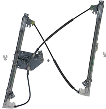
POWER WINDOW RIGHT ALZACRTISTALLI ELETTRICO DX

THIS INSTALLATION INSTRUCTION IS FOR BOTH LEFT AND RIGHT SIDE. CETTE INSTRUCTION DE MONTAGE EST POUR LES DEUX COTES DROIT ET GAUCHE. DIESE MONTAGE-ANLEITUNG IST FÜR DIE BEIDE LINKE UND RECHTE SEITE. ESTA INSTRUCCION DE MONTAJE ES PARA LOS DOS LADOS IZQUIERDO Y DERECHO. ESTAS INSTRUÇÕES VALEM TANTO PARA O LADO ESQUERDO QUANTO PARA O DIREITO. LA PRESENTE ISTRUZIONE VALE SIA PER IL LATO SINISTRO CHE PER IL LATO DESTRO.