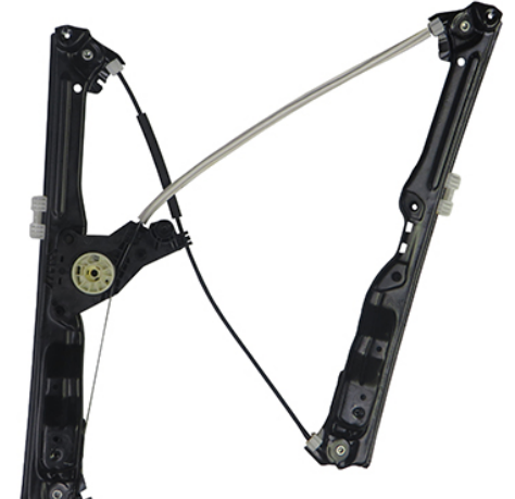
ORIGINAL POWER WINDOW RIGHT ALZACRTISTALLI ELETTRICO ORIGINALE DX